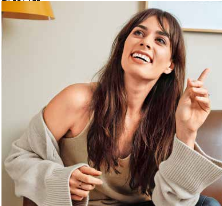
Die Musikerin beim SONGWRITING zu Hause in New York